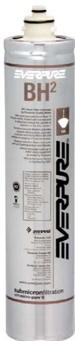
BH 2 Filterpatrone: 9612-51

Liefert Premiumwasser höchster Qualität für Kaffeeanwendungen