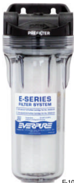
E-10 Vorfilter System 9795-80 EC110 Prefilter Patrone 9534-40

Vorfiltersystem für Anwendungen im Lebensmittelbereich