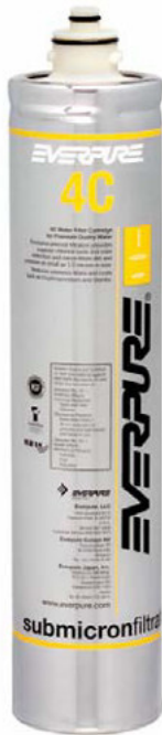
4C Filterpatrone EV960100

Liefert Premiumwasser höchster Qualität für Kaltgetränkessysteme