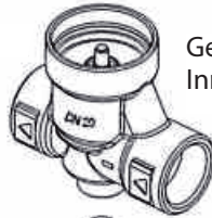
Gehäuse Innengewinde 3/4"