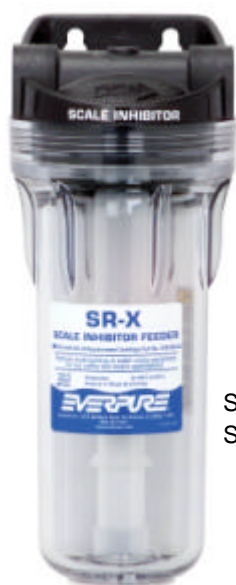
SR-X Feeder 9798-45 SS-10 Scalestick : 9799-02

Verhinderung von Kalkablagerungen und Schutz vor Korrosion für höchste Ansprüche..