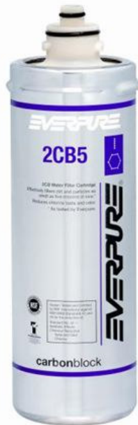
2CB5 Austauschpatrone: EV961705

Liefert Premiumwasser höchster Qualität für Lebensmittel-, Vending und OCS-Anwendungen.